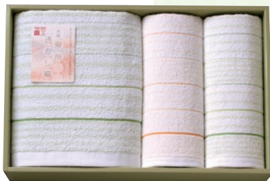
バスタオル1枚・フェイスタオル2枚