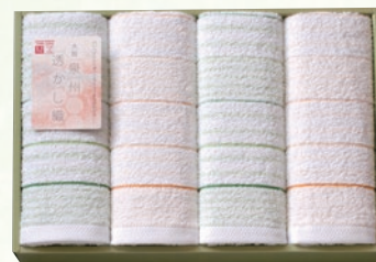
フェイスタオル4枚