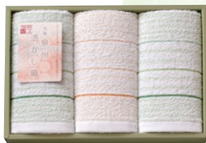
フェイスタオル3枚