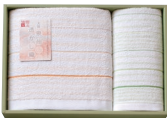
バスタオル1枚・フェイスタオル1枚