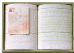
フェイスタオル2枚