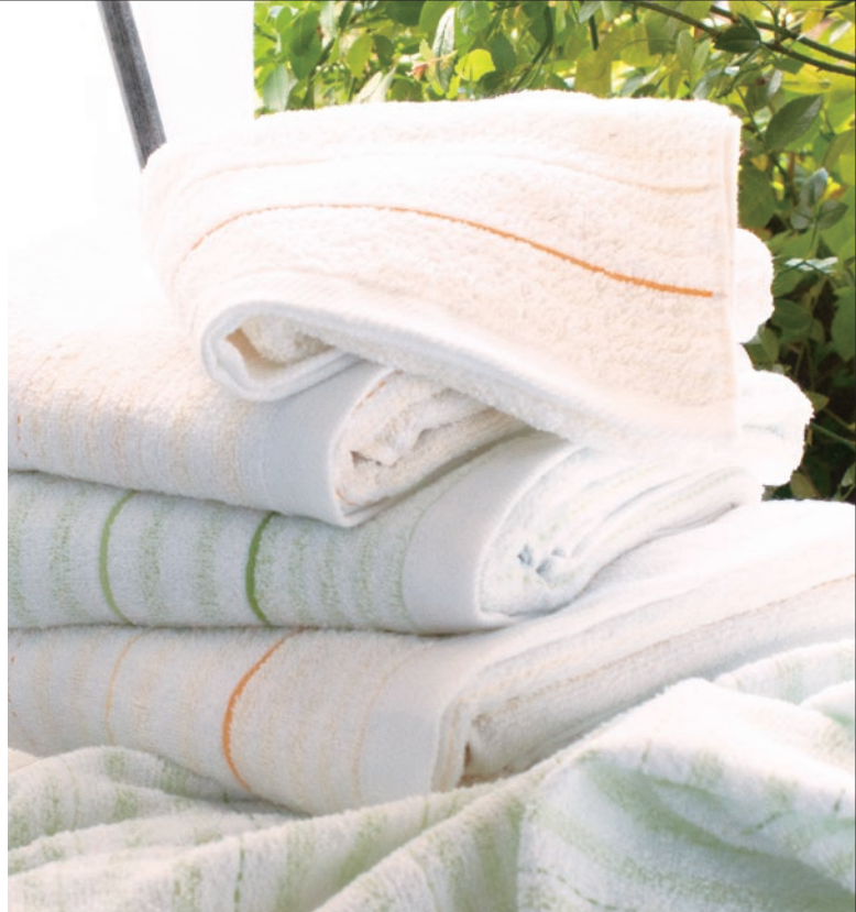
バスタオル／60×120cm フェイスタオル／34×80cm 【日本製】

泉州透かし織という技法で織り上げた「綿花美人」は、 毎日お使いいただいても色彩が長持する、 普段使いに最適なタオルとなっております。